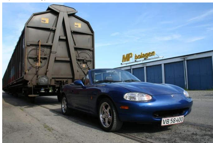
Søren fik en 3. plads i fotokonkurrencen

Redaktionen har desværre ikke modtaget noget referat fra denne traditionsrige tur.