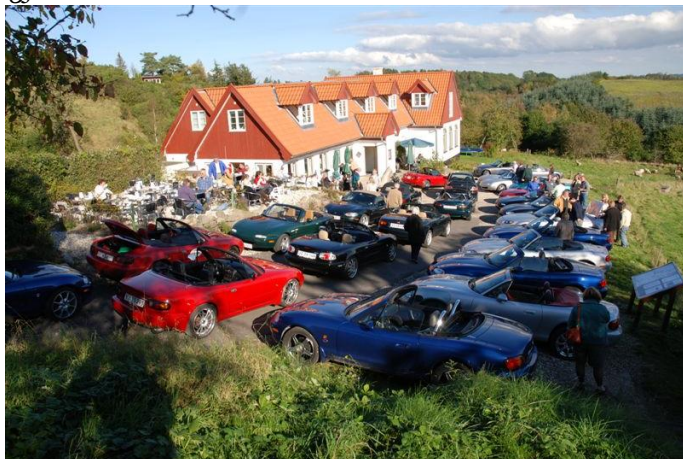
Så mange MX-5 ere er det sjældent vi ser på Maglesø.

Skul et byj sej en åen gång ku we da gjern komm igjen.