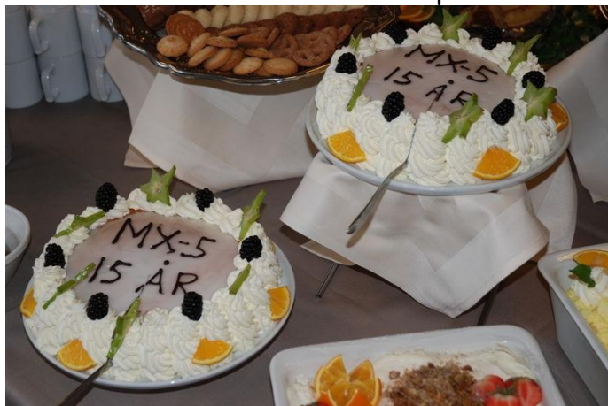
Selvfølgelig var der sørget for en rigtig 15 års fødselsdagslagkage til klubben.