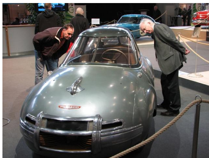
Panhard Dynavia 1948 - 3,5 ltr. / 100 km. CW værdi 0,7

Udstillingen bestod i hovedtræk af temaerne "Historisk motorsport", "Klubudstillinger", "Motorcykler", "Salgsbiler" og div. udbud af stumper.