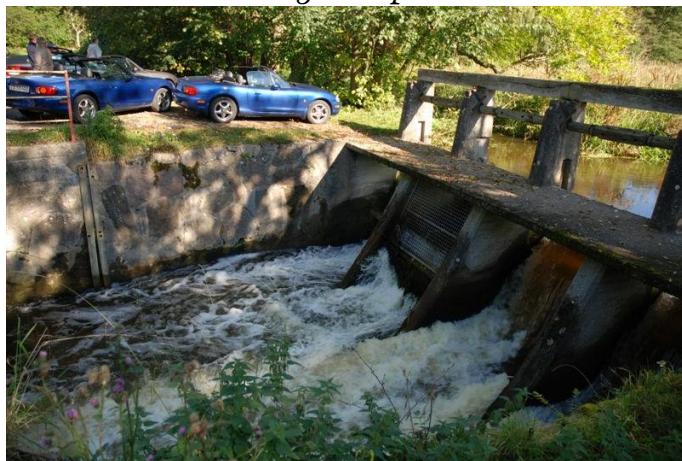
Pit-stop ved et gammelt stemmeværk ved en vandmølle.

We war da ow de føst der kom te æ tank hwo wi sku møes mæ de anne. Wi blew 12 kjørtøjer inen we startet o æ tue mæ Helge i æ spis.