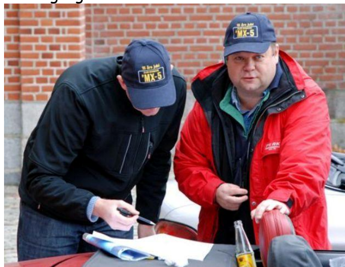
Bestyrelsen havde sørget for 15 års jubi caps til de deltagende medlemmer