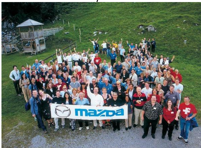
Hele holdet fra 2002 samlet efter en tur med lift op til en ski-restaurant