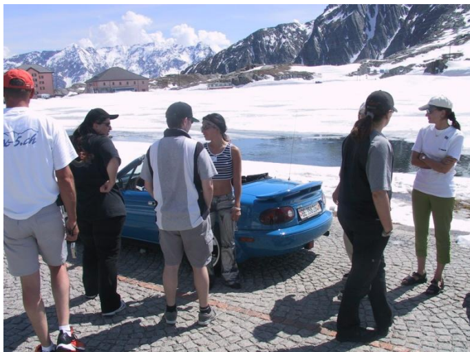
I ført sandaler og shorts gik turen op i sneen i Alperne

Efterhånden vil der komme mere information på: www.ccr2011.ch .