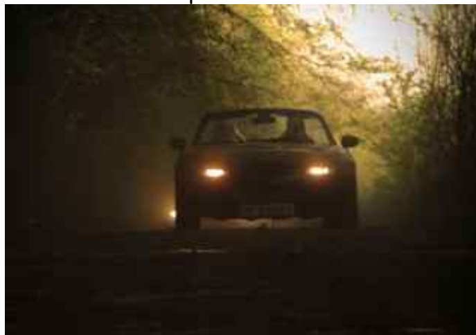
Delt nr. 2 Christian Lunding