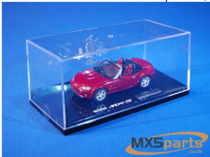
Modelbil fra Mazda (MMP) NC Launch Edition (1:43) i rød (True red) Excl evt. forsendelse.