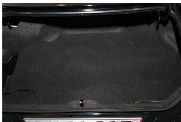
Det færdige resultat