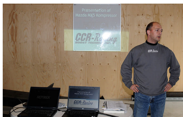
Christian fra CCR - racing