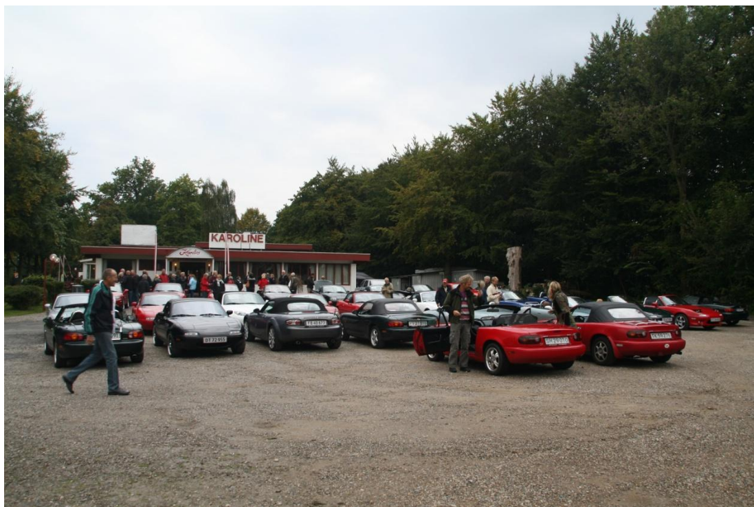
Nogle gange kan der være op til 40 biler til en fælles køretur

Bemærk at mange af arrangementerne er udførligt beskrevet i Roadstar nr. 44, side 19 – 24, hvorfor de ikke vil blive gentaget her.