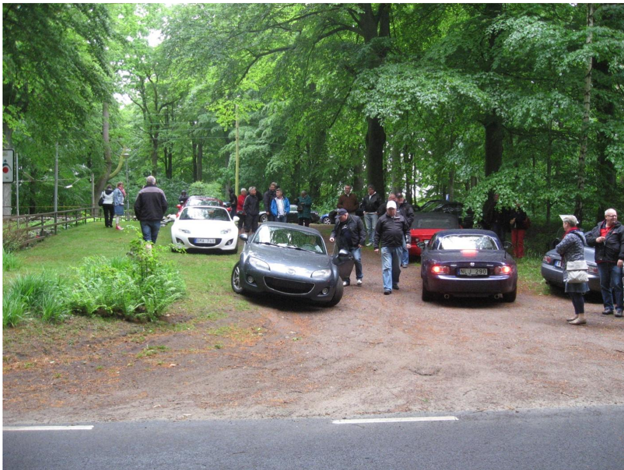
Skøn skov i Skåne

Det har altid af en eller anden grund været svært at samle et hold til besøget i Sverige. Jeg husker, at vi for et par år siden mødte op til deres arrangement "Danskerne kommer" med kun 3 biler, mens de holdt godt en snes biler og ventede på danskerne. Det var sgu' ret pinligt, og der var da også en af Miatafolkene som spurgte om der ikke kom flere.