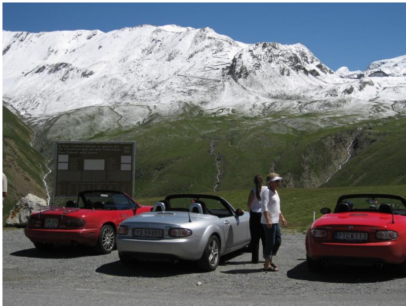
Alperne er bare imponerende

Tidligt op og afgang mod Danmark ved 9 tiden.