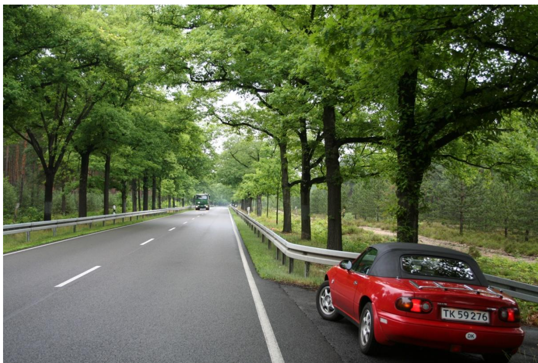
En typisk allé i det gamle Østtyskland. Brandenburg nær Cottbus.

Herunder blot et billede fra det gamle Østtyskland.