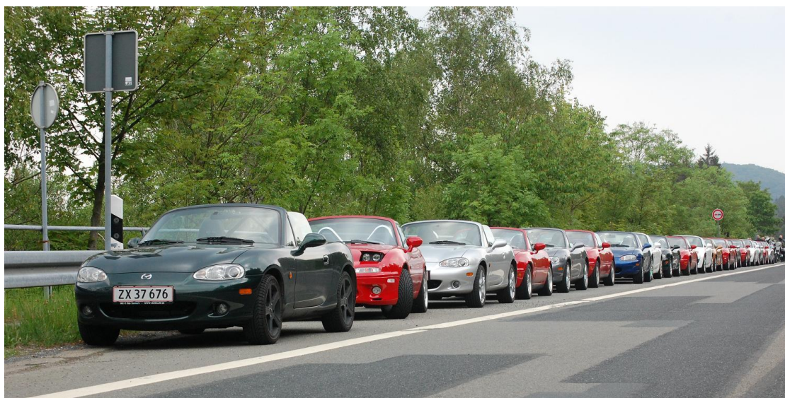
Klubben i Harzen 2011