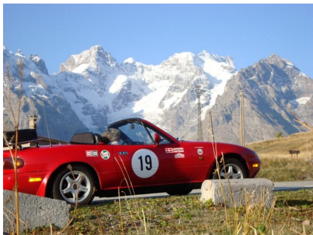
Petit St. Bernhard

På den videre færd, var det så direkte som muligt, tilbage på "la Route" og blandt andet op over Col de Iseran, Europas højeste pas. Vi havde planlagt endnu en omlægning af den sædvanlige rute, idet vi fra Bourg St Maurice ville op over Lille St. Bernhard, ind i Italien til Aosta og videre ad den gamle pasvej over Store St. Bernhard. Den nordligste del af Route des Grandes Alpes har dels været prøvet før og dels er den knap så rå som Bernhard-turen.