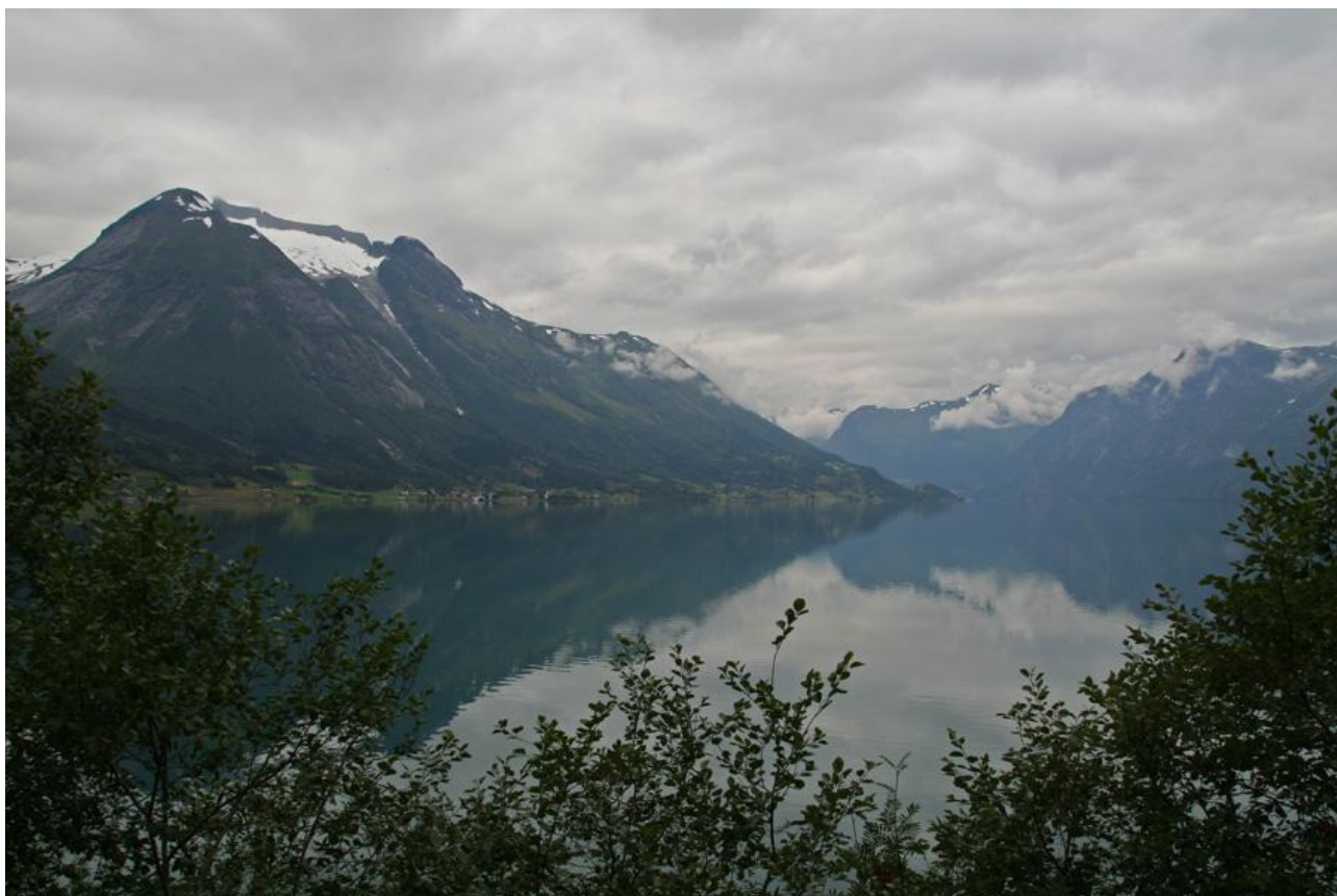
9522. Fra Voss mod Vik på rute 13

De gange, vi har planlagt en tur til Norge, har vi derfor altid haft en Plan B, der som regel bliver udløst, men sommerferien i august 2012 blev undtagelsen efter vores seneste ferietur til Norge i 2003.