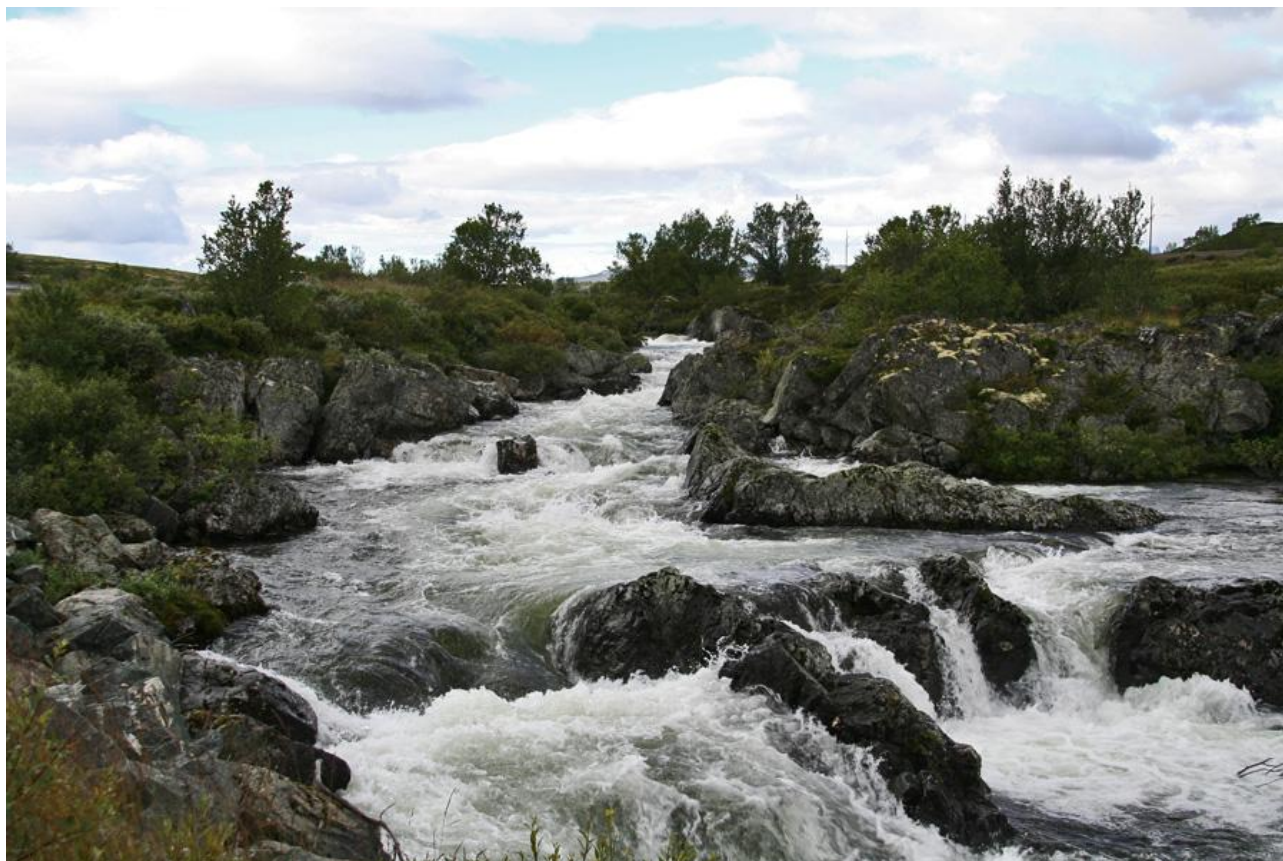
9627. På vejen fra Oppdal mod Rondane

Norske huspriser er i øvrigt ikke for sjov og landet står også i fare for at blive ramt af en boligboble, men det starter med prisen for byggegrunden for f.eks. en fjeldhytte, der nemt ligger på 1,5 mio. NOK.