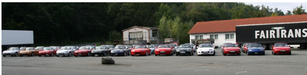
Absolut Fair Trans for 44 danske og svenske MX-5'ere i Harzen i efteråret 2012