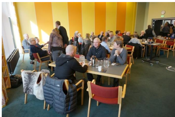
Fra generalforsamlingen i 2013