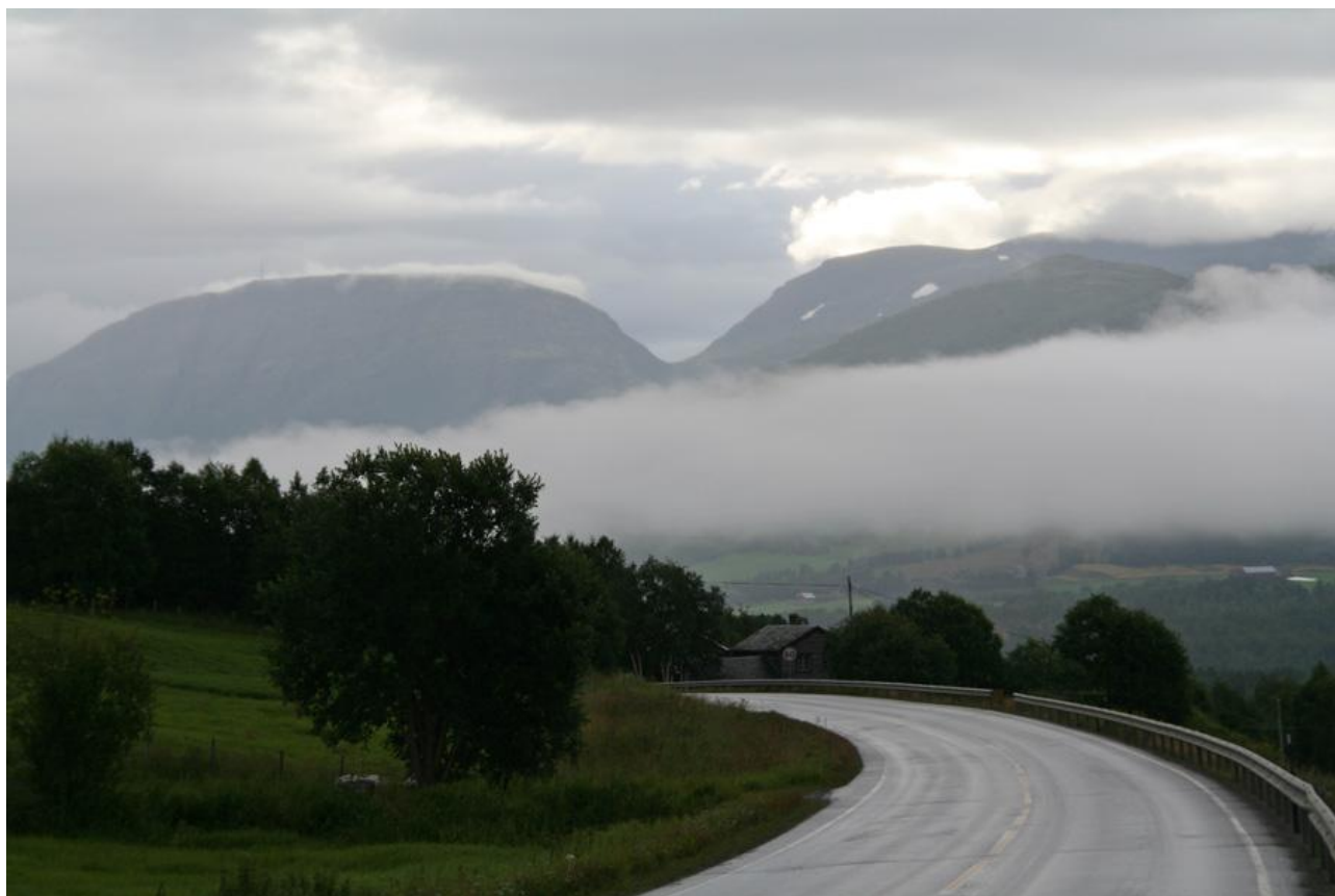
9615. Mellem Sunndalsøra og Oppdal

F.eks. et Kneippbrød på 750 gram ned til 7 kroner i mange Coop butikker.