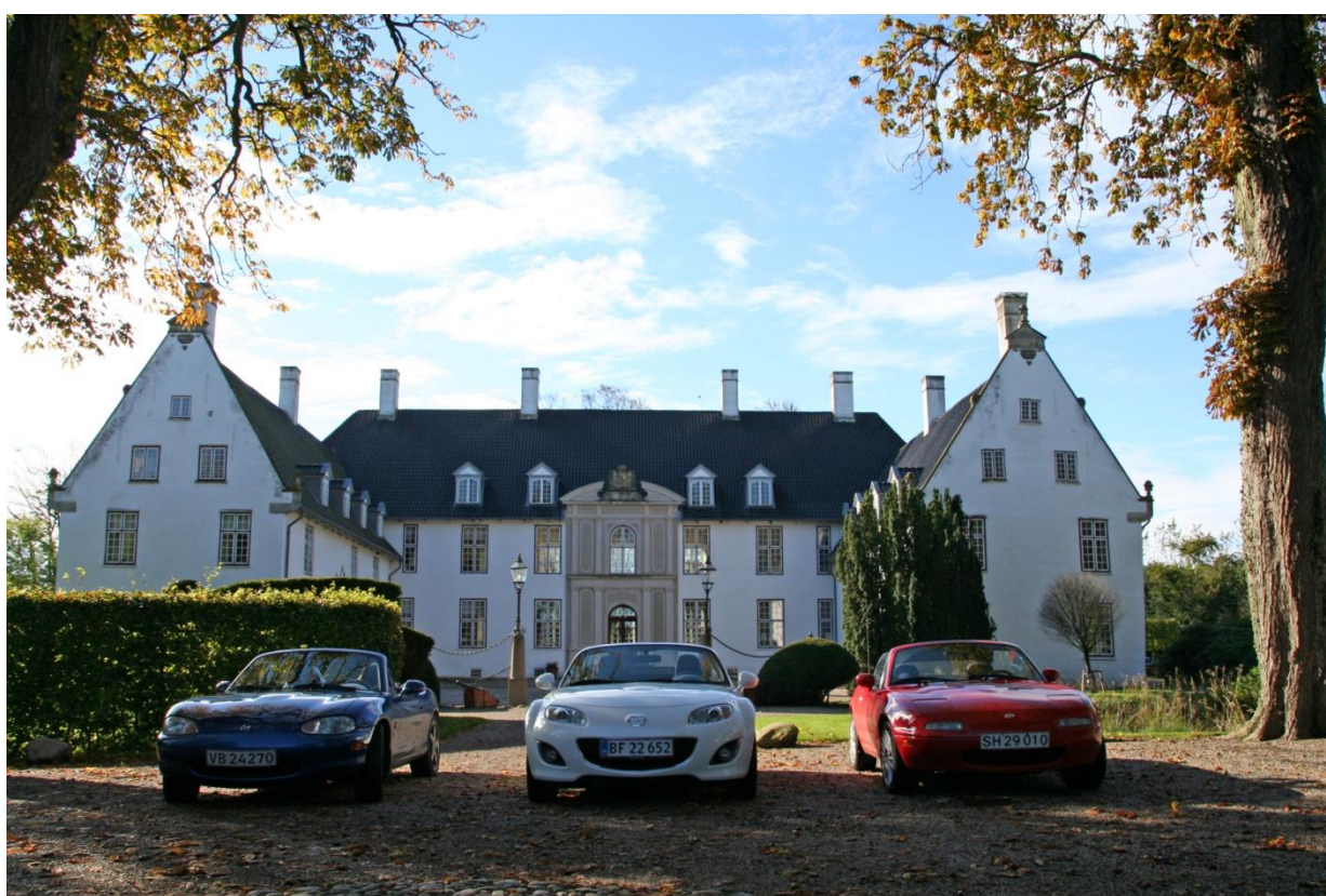
Tricolore med MX-5'ere foran Schackenborg Slot på Sort Sol - turen den 6. oktober 2012.