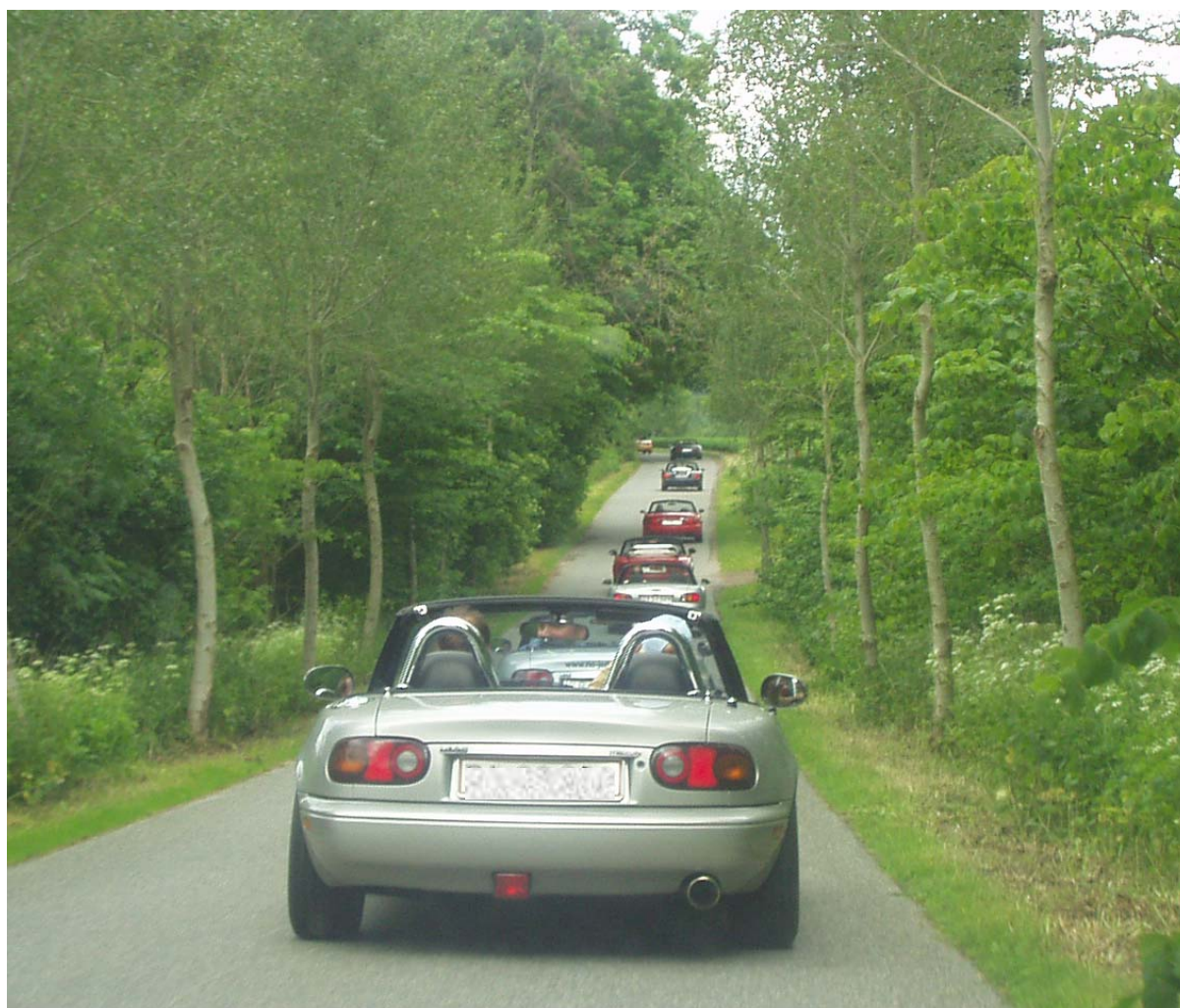
Kortegekørsel -den ultimative køreglæde