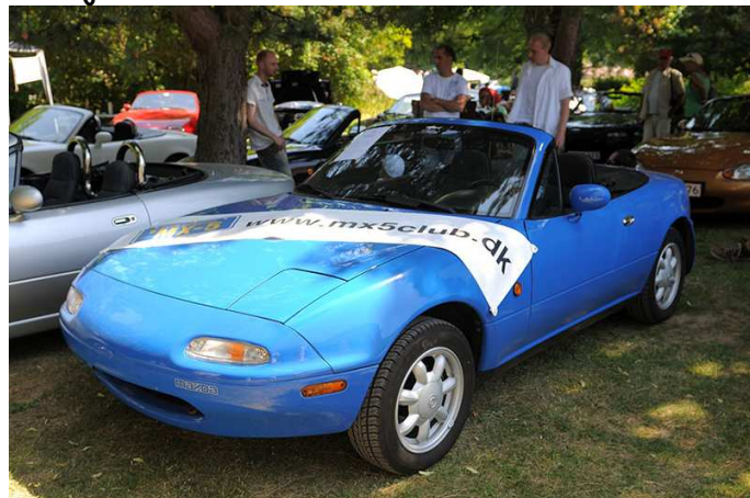
Fra Gavnø 2008 Tilmelding og yderligere oplysninger på gavnoe.dk/dk_nyheder/autoshow-nyhed

Igen i år har vi et område ved Gavnø Classic Autojumble.