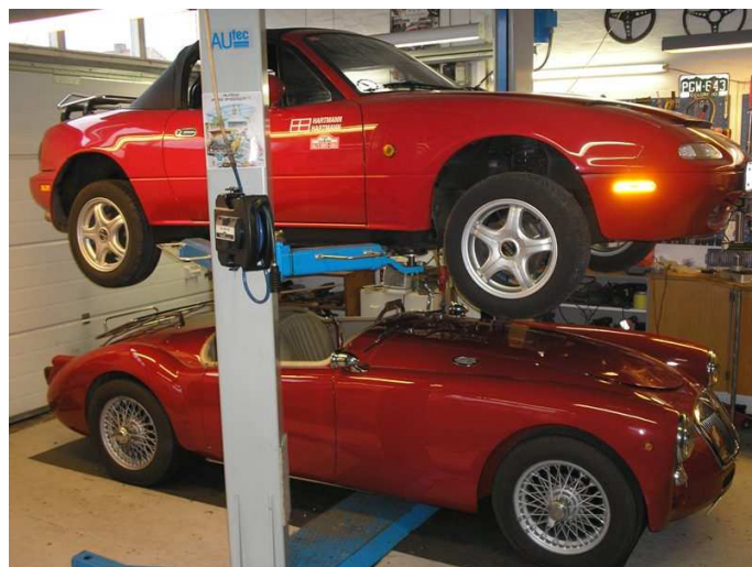
De er også lige lange

PS. RUNA udgør, sammen med BAUTA, Lærestandens Brandforsikring og FDM Forsikring, LB Koncernen.