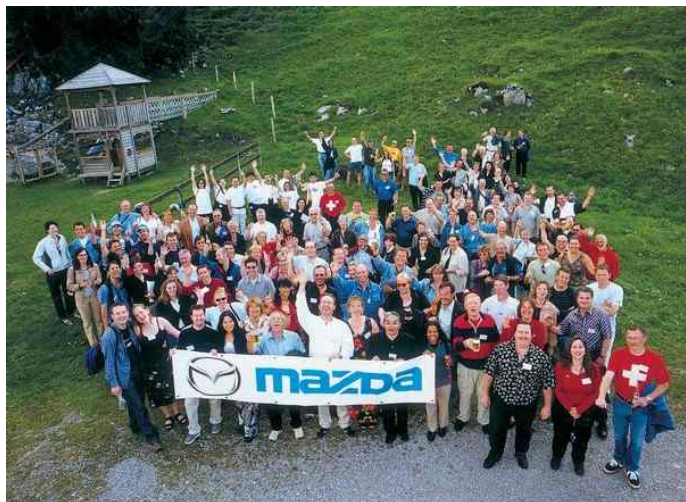
Hele holdet fra 2002 samlet efter en tur med lift op til en ski-restaurant

Jeg deltog i 2002 og det var et rigtigt godt træf, med ture både op i alperne og nede i det varmere terræn.