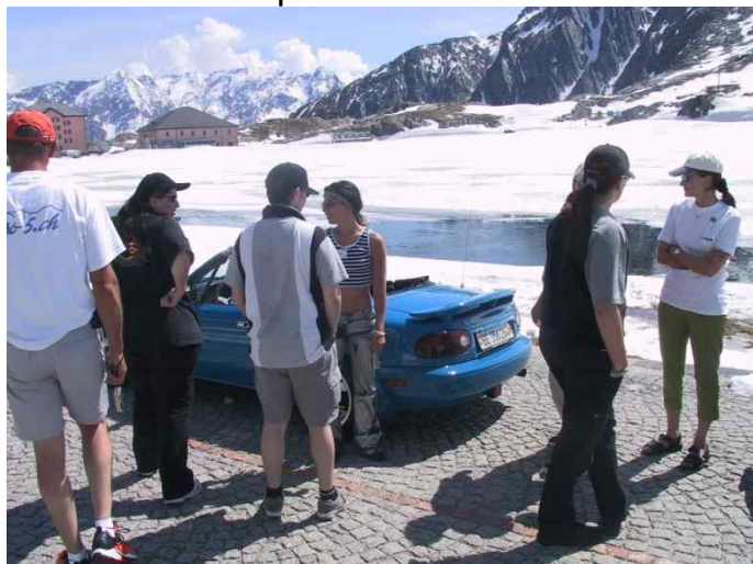
I ført sandaler og shorts gik turen op i sneen i Alperne

Programmet, priser m.v. kan ses på: www.ccr2011.ch , hvor man også kan tilmelde sig.