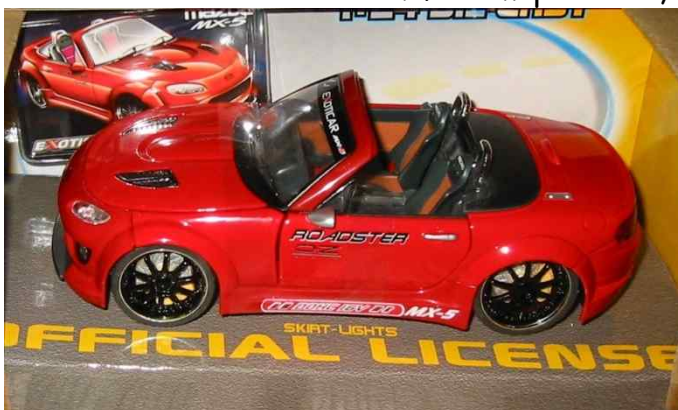
Modelbil fra Exoticar. NC (1:24) i grå, blå, rød og gul. excl. evt. forsendelse