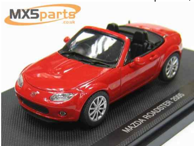
Modelbil fra Ebbro. NC (1:43) i sølv (Sunlight silver), rød (True red), grøn (Nordic Green) & sort (Brilliant black). Excl evt. forsendelse.