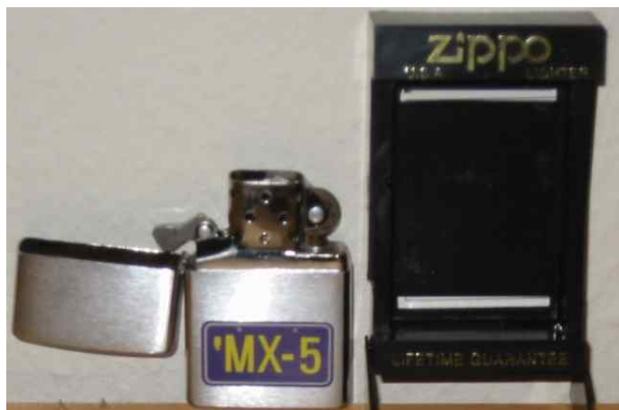
Zippo lighter m. logo incl. evt. forsendelse Normalpris 200,- Medlemspris 125,-