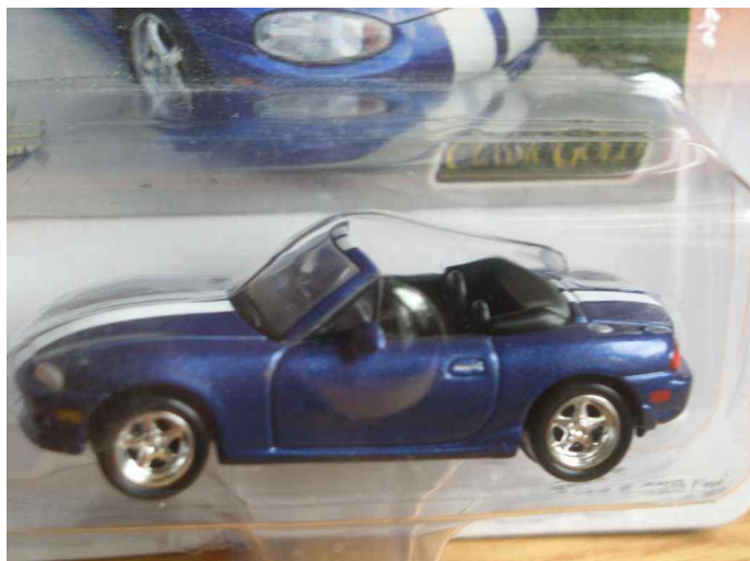
Modelbil fra Johnny Lightning. NB Jubi (1:64) blå med hvide striber. Excl. evt. forsendelse.