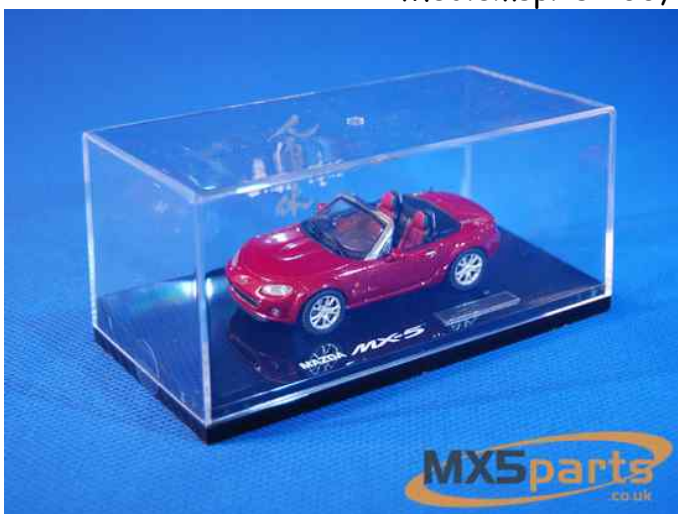
Modelbil fra Mazda (MMP) NC Launch Edition (1:43) i rød (True red) Excl evt. forsendelse.