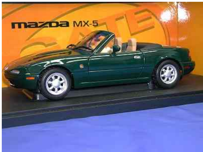
Modelbil fra Gates. NA (1:18) i sølv, grøn eller blå. Excl. evt. forsendelse