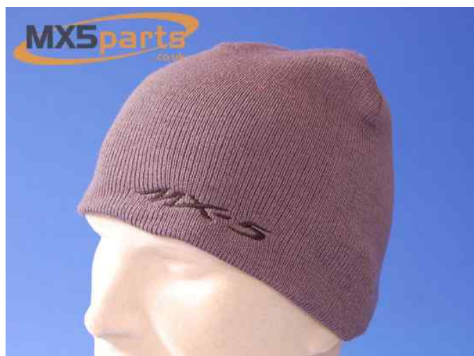
Hue med broderet MX-5 logo. Excl. evt. forsendelse