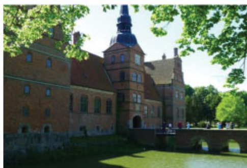
Rosenholm Slot grundlagt i 1559

Efter at være blevet en del klogere på slægten Rosenkrantz og slottets historie, fortsatte turen omkring Mørke – Thorsager (med en tur omkring Rundkirken) – Rønne, for at ende ved Kalø Slotsruin, hvor vi fortærede vores medbragte madpakker.