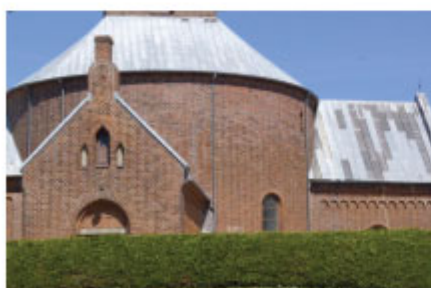
Thorsager Rundkirke ca. år 1200