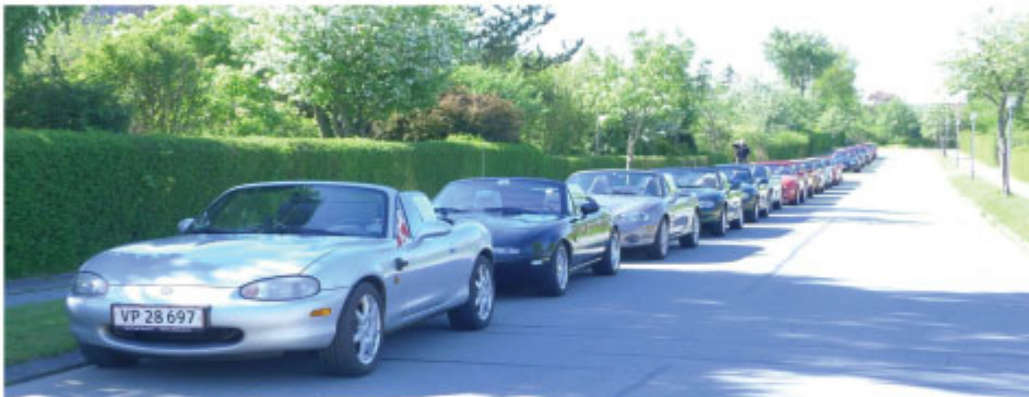
Et flot syn på en stille villavej.