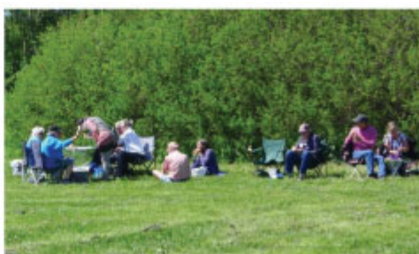
Frokost i det grønne ved Kalø Slotsruin